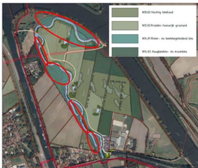
Figuur 2a. Locatie Kop Guldenland bij Aarle-Rixtel. De rode omlijnende gebieden geven de rustige oevers weer geschikt voor nieuwe oeverholten van de bever.