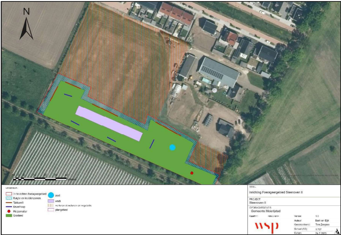
Figuur 2. Locatie van de te realiseren permanente voorzieningen en de te verwijderen vegetatie.