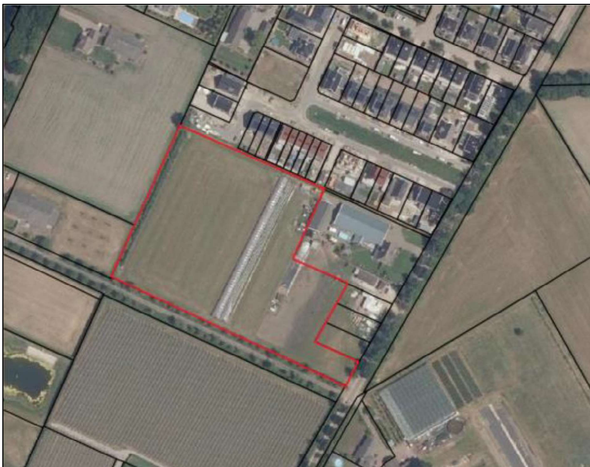
Figuur 1. Locatie aan de Heiakkerstraat te Veghel (kadastraal perceel: sectie N, perceelnummer 2601, kadastrale gemeente Veghel). De activiteiten vinden plaats binnen het rood omlijnde gebied.