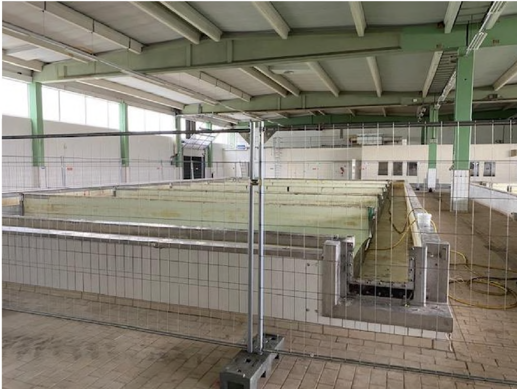
Bestaand gebouw zou worden gebruikt voor aanpassing CIP installatie