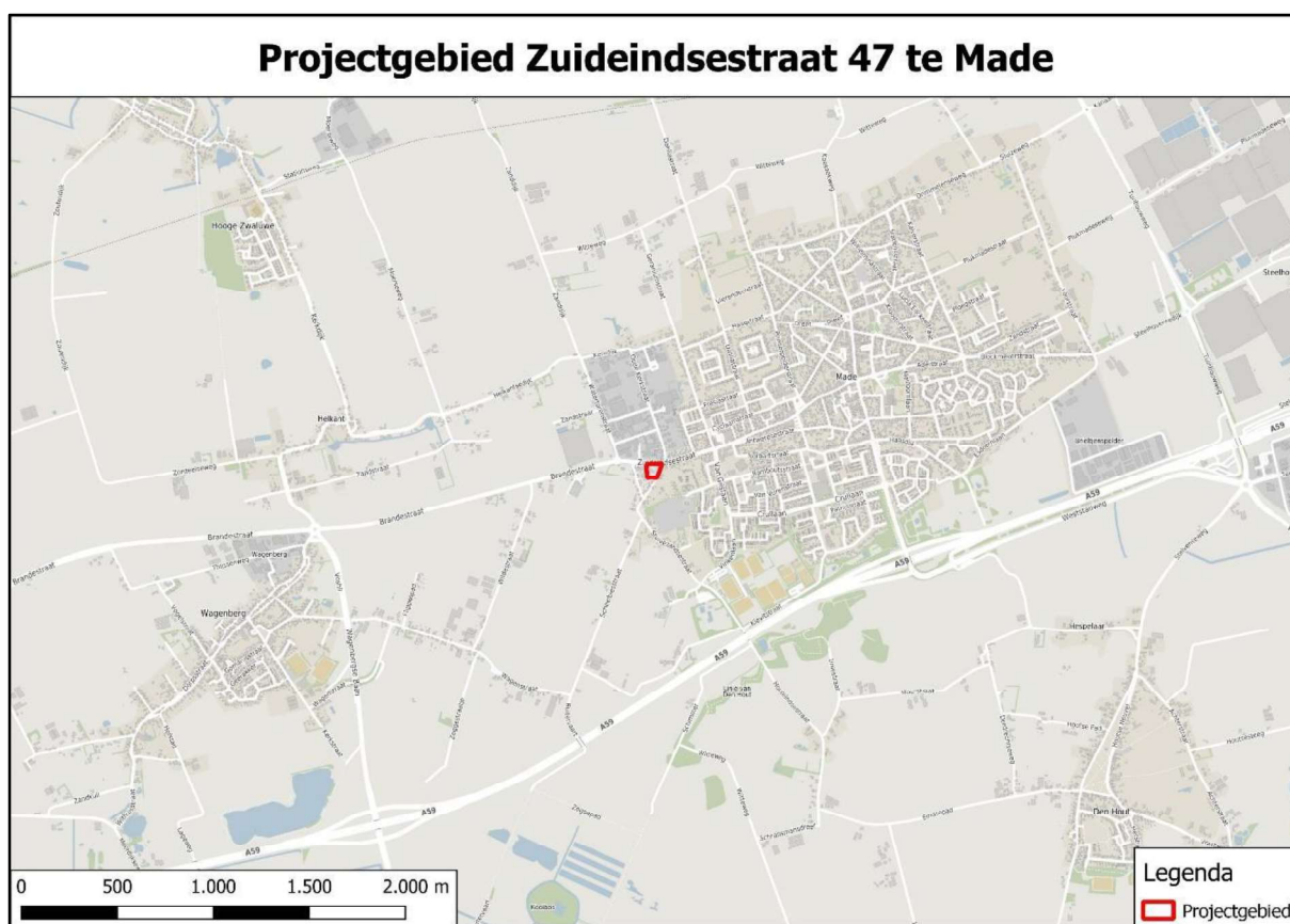
Figuur 1. Locatie Zuideindsestraat 47, 4921 XL te Made, gemeente Drimmelen. De activiteiten vinden plaats binnen het omliggende gebied.