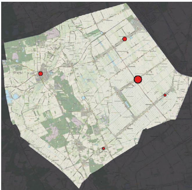
Figuur 2: Locatie broedkolonies van de roek binnen de gemeente Borger-Odoorn, met rechtsboven de overlastlocatie in Nieuw-Buinen

Door de landelijke omgeving is gemeente Borger-Odoorn uitermate geschikt als foerageergebied voor roeken. Gecombineerd met hoge bomen binnen de dorpskern van o.a. Nieuw-Buinen vormt dit een het ideale leefgebied. Binnen de gemeente komen meerdere kolonies voor. De grootste in 2 e Exloërmond welke bestaat uit 155 nesten. Een andere grote kolonie is gevestigd in Borger en bestaat uit 107 nesten. De kolonie in Nieuw-Buinen bestaat uit circa 40 nesten, maar geven het meeste overlast wat resulteerde in meldingen door ongeveer 25 huishoudens.