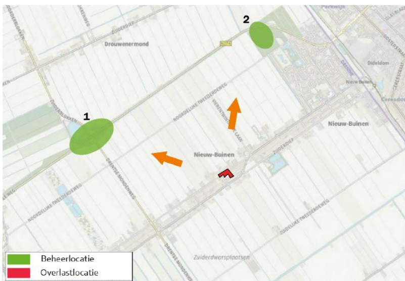
Figuur 3: In rood de overlastlocatie en groen de aangewezen beheerlocaties

Twee locaties in de omgeving van Nieuw-Buinen kunnen aangewezen worden als beheerlocaties. Deze locaties liggen echter beide op meer dan 1000m van de overlastlocatie, aangezien dichterbij geen geschikte locaties voor handen zijn. Het gaat om de locaties ter hoogte van de N374 en het Buinerhornse bos (zie figuur 3).