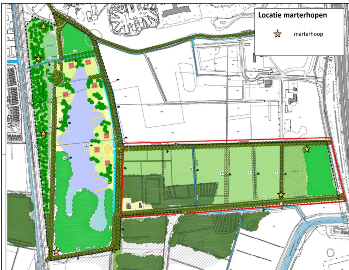
Figuur 4. Locaties martherhopen in de nieuwe situatie.