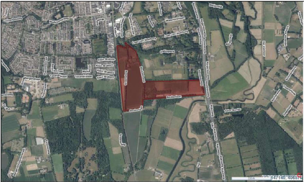
Figuur 1. Locatie projectgebied van het Landgoed Groensche Hoeven, gelegen nabij de Groensteeg, 5261 LD te Vught. De activiteiten vinden plaats binnen het omlijnde gebied.