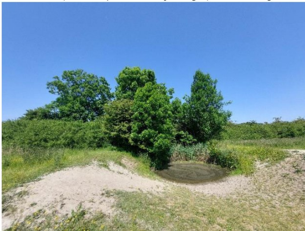
Figuur 3 Huidige situatie Heggenlandschap met een bestaande pool 8-6-2023