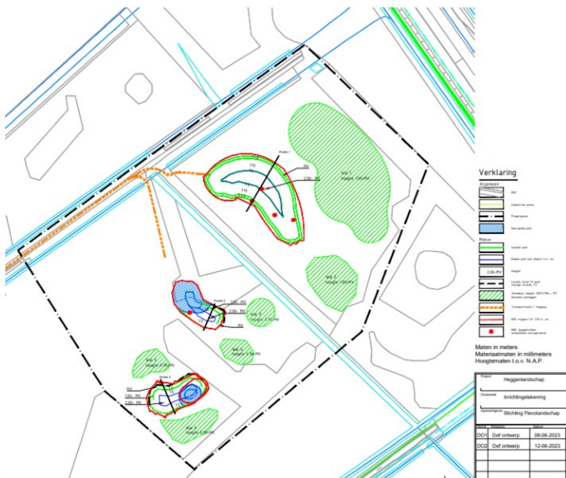
Figuur 2: Aanleg van waterpoelen met terrein reliëf (groen)

Hiervan zal alles op het zelfde perceel worden verwerkt. Deze grond wordt gebruikt voor meer natuurlijke reliëf in de kavel, wat de uitgangssituaties voor de flora en fauna zal verbeteren en zorgt voor het versterken van de natuurkwaliteiten in het gebied. De ontgroning is niet gericht op het winnen van oppervlaktedelfstoffen.