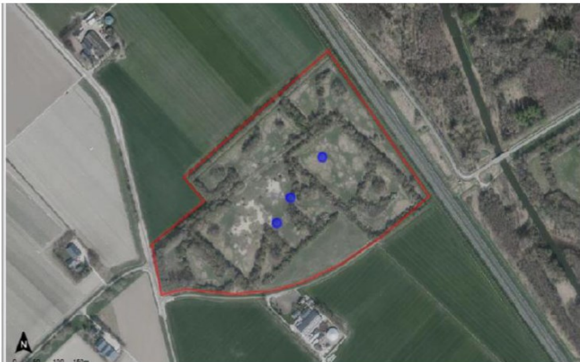
Figuur 1: Ligging van het projectgebied met bij blauw de poelen.

De ontgroning zal worden gerealiseerd op het kadastrale perceel: gemeente Lelystad, sectie L nummer 366.