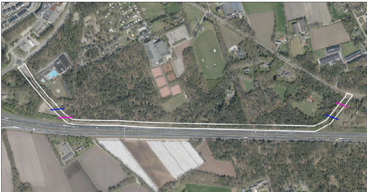
Figuur 2. Locaties van de aan te leggen faunatunnels voor marterachtigen (blauw) en amfibieëntunnels (roze) onder de verbindingsweg.