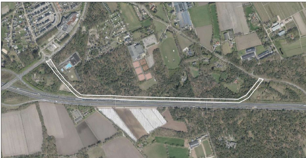
Figuur 1. Locatie van de verbindingsweg Kempenweg-Eindhovensedijk. De activiteiten vinden plaats binnen het omliggende gebied.