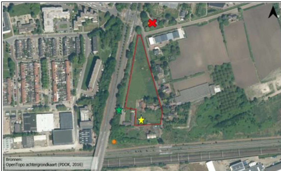
Figuur 3. De locatie van de permanente voorzieningen worden aangegeven met de groente ster en de oranje stip.