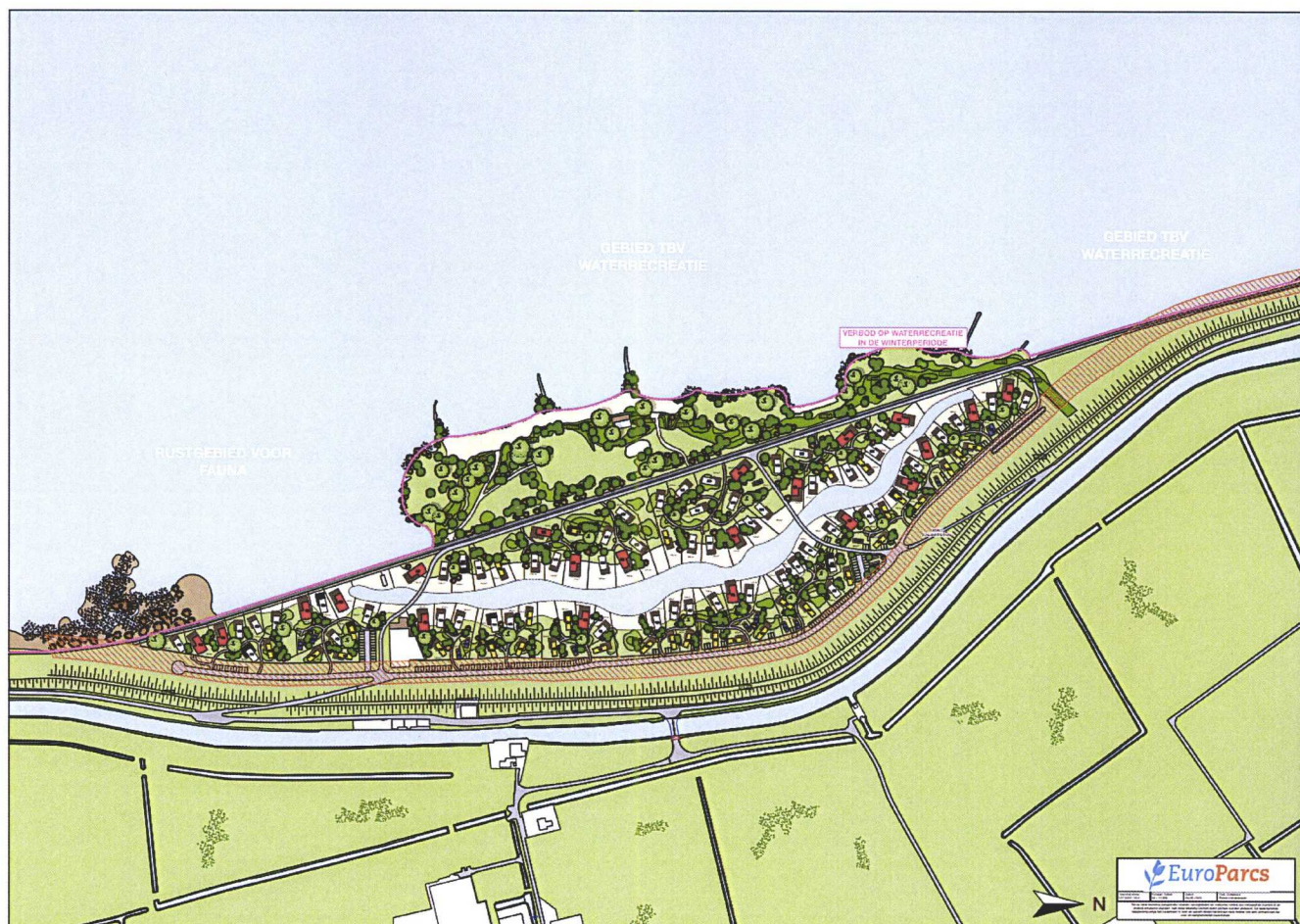
Figuur rustgebied zuidzijde tijdens zomerperiode. Recreatie vindt plaats aan noord- en westzijde van het park.

Ten aanzien van waterrecreatie aan de zuidzijde van het park heeft u aangegeven dat dit in de zomerperiode aan de noord en westzijde van het park zal plaatsvinden. Dit creëert een rustgebied aan de zuidzijde. Aan de zuidzijde zijn verbodsborden geplaatst en waterrecreatie aan de zuidzijde wordt actief ontmoedigd (ter hoogte van het rustgebied). Zie onderstaande figuur.