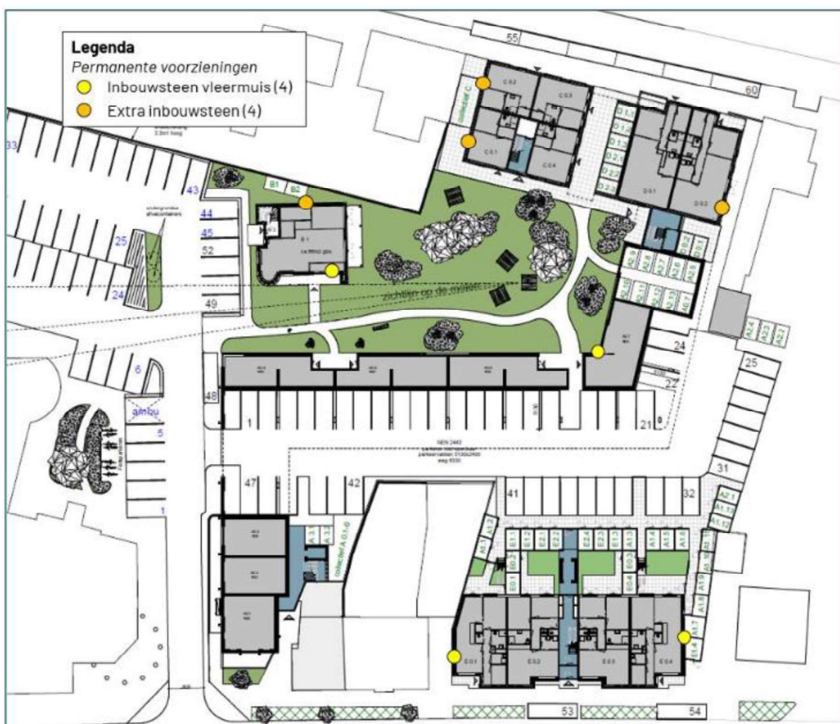
Figuur 2. Locatie van de permanente voorzieningen.