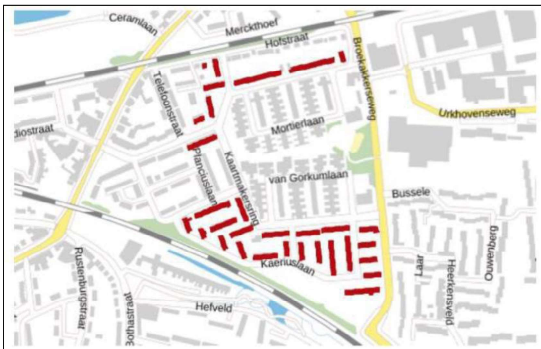
Figuur 1. Overzicht GAN-cluster 513 (rood gemarkeerde woningen)