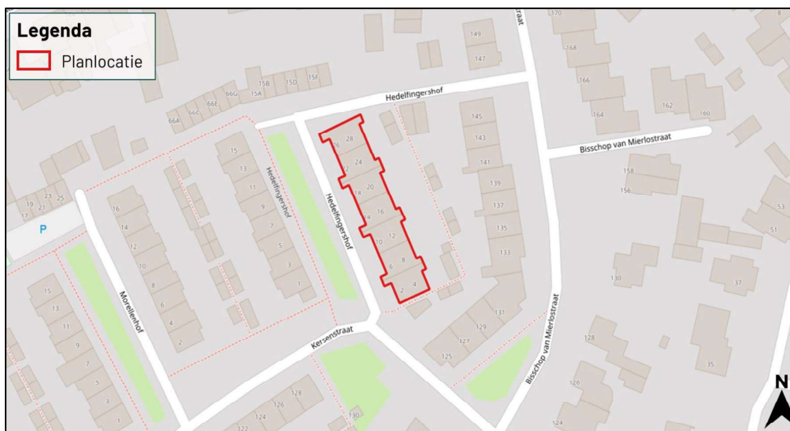
Figuur 1. Locatie Hedelfingershof 2-28 te Mierlo. De activiteiten vinden plaats binnen het omliggende gebied.