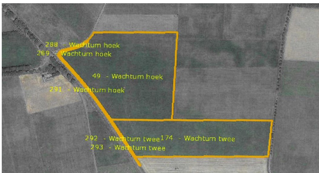
Figuur 1. percelen ontheffing

Wij hebben besloten op basis van onderstaande motivering aan u een ontheffing te verlenen op basis van artikel 3.3 van de Wet natuurbescherming (Wnb) voor het doden van roeken met behulp van geweer ter ondersteuning van de aangebrachte preventieve middelen vanaf één uur voor zonsopkomst ter voorkoming van belangrijke schade aan kwetsbare gewassen op de percelen uit uw aanvraag zoals weergegeven op onderstaande figuur 1.