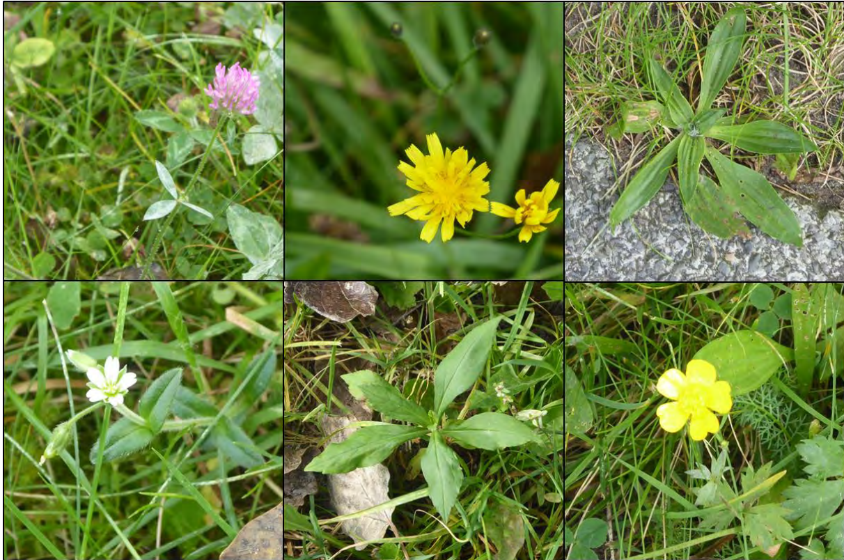
Figuur 2.1. Impressie van de flora in het plangebied.

Het plangebied wordt gekenmerkt door grasland met soorten zoals onder andere Engels raaigras, smalle weegbree, paardenbloem, rode klaver, havikskruid en gewone hoornbloem. Het plangebied is vanwege voedselrijke habitateigenschappen ongeschikt voor beschermde flora en deze zijn ook niet aangetroffen.