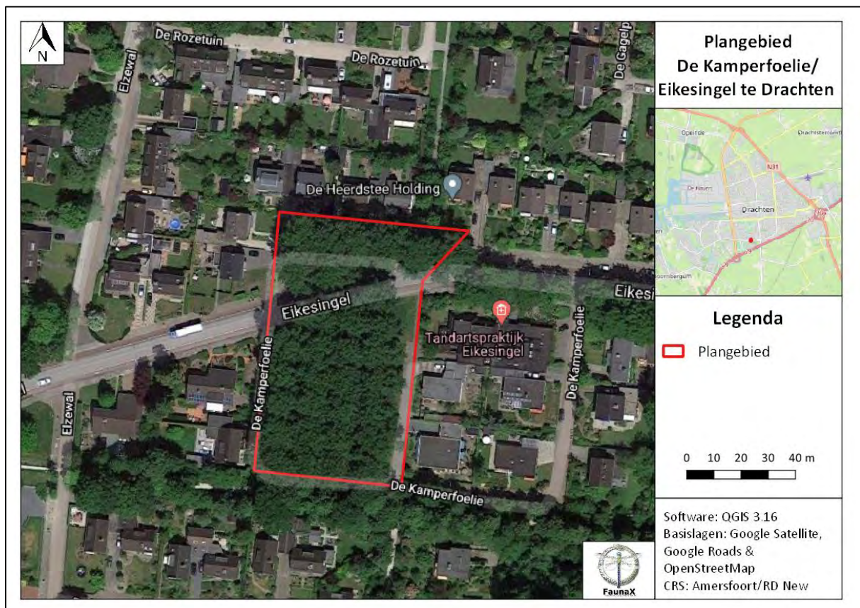
Figuur 1.1. Het plangebied te Drachten.

Omdat een deel van bovenstaande maatregelen een ruimtelijke ingreep betreft, dient een toetsing te worden uitgevoerd in het kader van de Wet natuurbescherming (Wnb). Deze toetsing vindt eerst plaats in de vorm van een quickscan gebaseerd op het onderdeel soortbescherming. In het kader daarvan is door Bureau FaunaX een analyse gemaakt van de (mogelijk) binnen de invloedssfeer aanwezige beschermde natuurwaarden. Hierbij ligt de focus op flora en alle diergroepen waarvan redelijkerwijze kan worden verwacht dat beschermde soorten voor kunnen komen in het plangebied. Tevens is een inschatting gemaakt van de eventuele effecten van de voorgenomen plannen op in de omgeving liggende beschermde natuurgebieden (Natura 2000 en NNN/EHS) (onderdeel gebiedsbescherming).