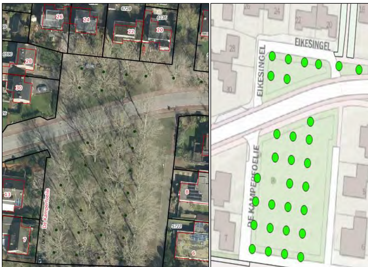
Figuur 1.2. Impressie plangebied.