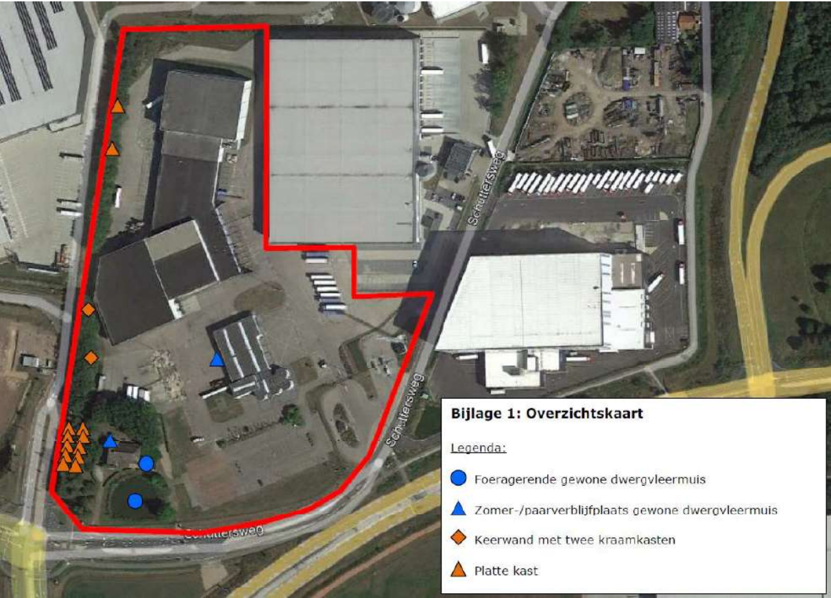
Figuur 2. Locatie van de tijdelijke voorzieningen. De aangetroffen verblijfplaatsen (blauwe driehoek) betreffen enkel paarverblijfplaatsen van de gewone dwergvleermuis.