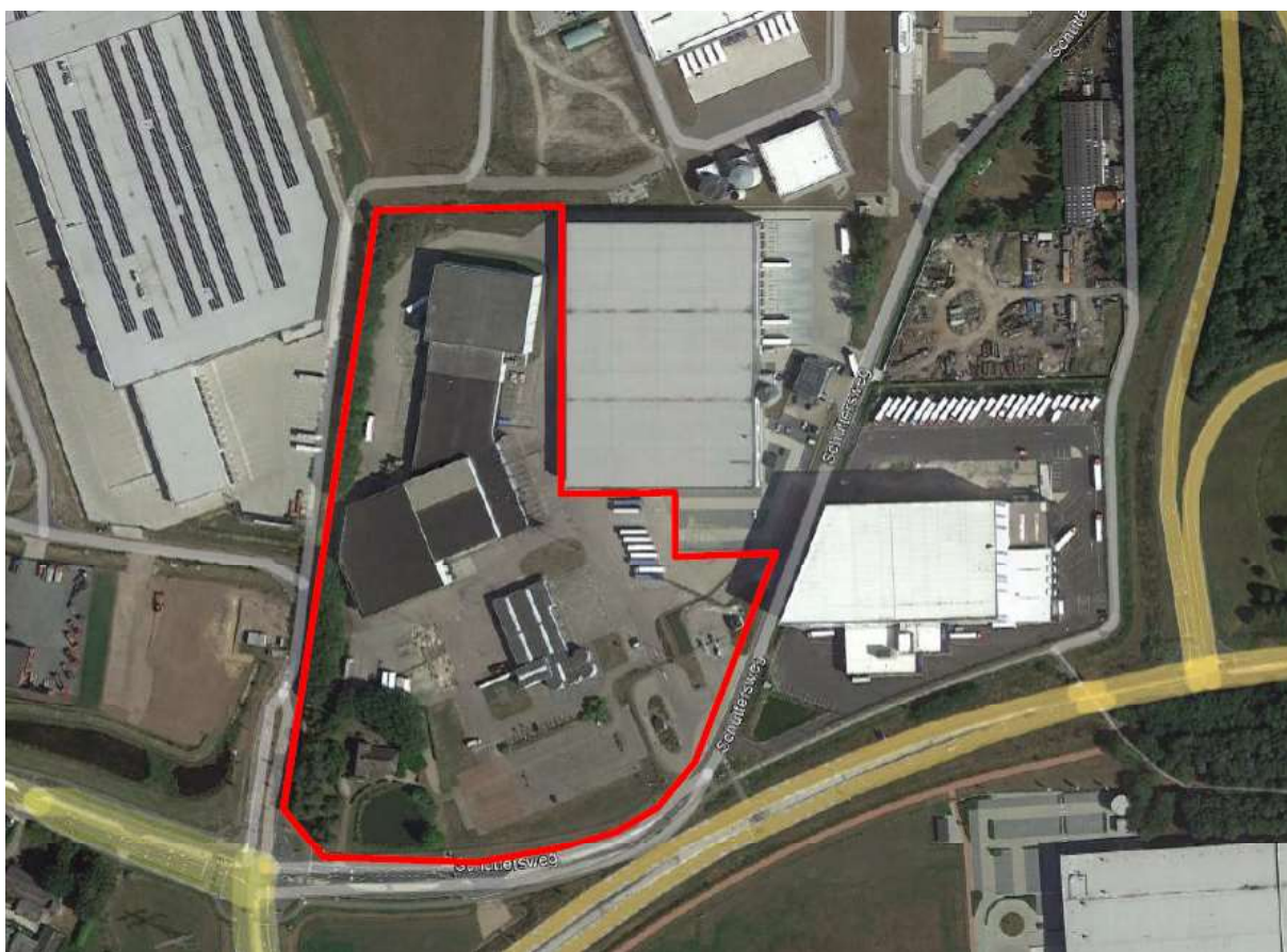
Figuur 1. Locatie Schuttersweg 16 te Haps. De activiteiten vinden plaats binnen het omlijnde gebied.