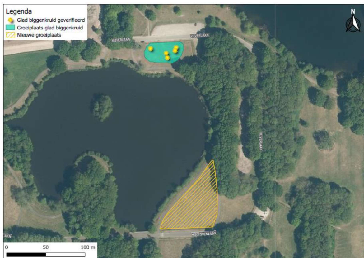
Figuur 2: de locatie van de nieuw te realiseren groeiplaats ten opzichte van de huidige groeiplaats (bron luchtfoto: PDOK, 2022).

Figuur 2. Locatie van de nieuwe groeiplaats (geel gestreept).