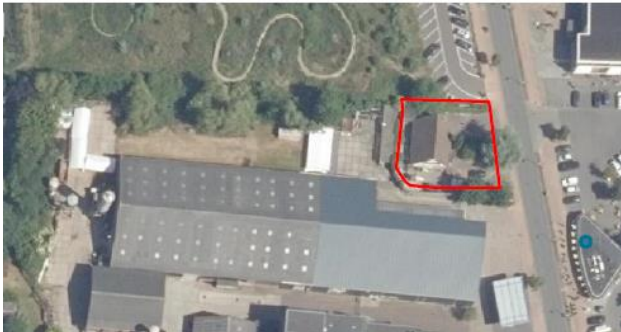
Figuur 2 locatie de te slopen woning (Kanaalstraat 62i te Roden)

De ontheffinghouder is voornemens om de omgeving van het plangebied opnieuw te ontwikkelen. Om die reden is het noodzakelijk om een deel van het aanwezige groen te kappen en te snoeien en de aangrenzende woning (Kanaalstraat 62i) te slopen.