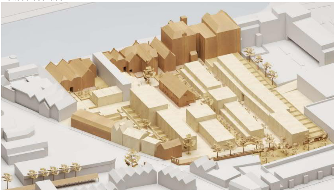
Afbeelding 3 herbouw Museumkwartier (SP Blauw blz. 43)

De sloop- en opruimwerkzaamheden in het plangebied zijn onderdeel van de herontwikkeling van het 'Museumkwartier'. Het plangebied bestaat voor het grootste deel uit voormalig 'Kwakkelstein' complex gelegen achter de Westhavenkade en de Vetteoordsekade.