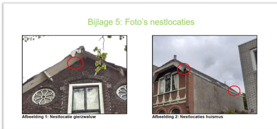
Afbeelding 5 Nestlocaties (inventarisatierapport adviesbureau Ecologisch)

De rapportages van de natuuronderzoeken zijn als bijlage toegevoegd.