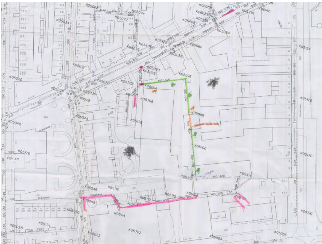
Afbeelding 4 Riolering Museumkwartier (inspectie riolering gemeente Vlaardingen, 40120088_02)

Op het terrein is historisch een rioolleiding aanwezig; deze loopt vanaf de percelen aan de Parallelweg (buiten plangebied) over het binnenterrein naar de Touwbaan (achter Vetteoordsekade 15). In verband met diverse bouwactiviteiten zal het in Afbeelding 3 met groen/oranje gemarkeerde deel verwijderd worden. De aansluitingen op doorgaande leidingen afgedopt 1 .