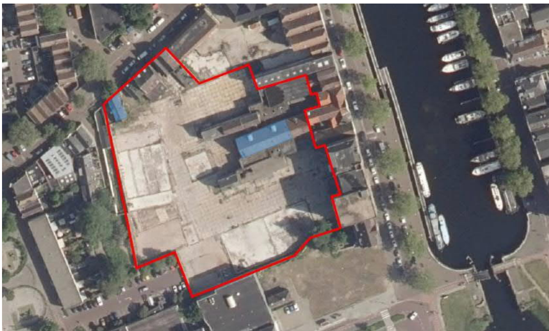
Afbeelding 1 Luchtfoto Museumkwartier (ca. 2019)