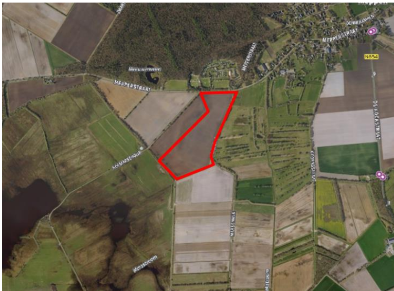
Figuur 1. percelen ontheffing

Wij hebben besloten op basis van onderstaande motivering aan u een ontheffing te verlenen op basis van artikel 3.3 van de Wet natuurbescherming (Wnb) voor het doden van grauwe- en kolganzen met behulp van geweer ter ondersteuning van de aangebrachte preventieve middelen vanaf één uur voor zonsopkomst ter voorkoming van belangrijke schade aan kwetsbare gewassen op de percelen uit uw aanvraag zoals weergegeven op onderstaande figuur 1.