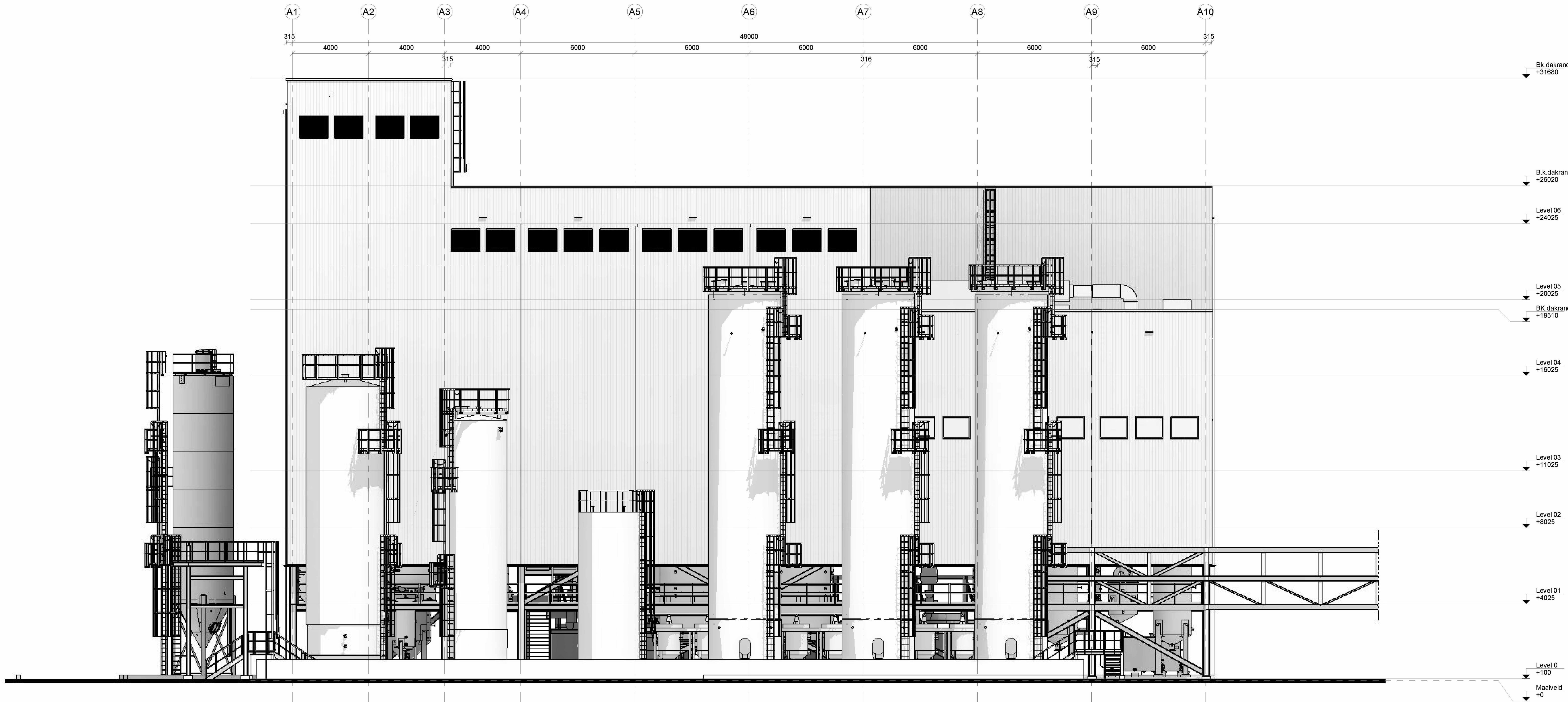
Westgevel Area A, B & C