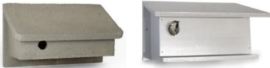
Figuur 10 Huismuskast NK.MU 08 (Vivara Pro (links, duurzame kast), wordt geplaatst aan de brandweerkazerne) en huismusnest kast HMT1 (unitura.nl, wordt geplaatst aan de villa).

Figuur 3: locatie op de brandweerkazerne waar vier van de acht externe huismuskasten dienen te worden opgehangen, met daaronder impressie van de acht externe huismuskasten van Vivara Pro en Unitura.