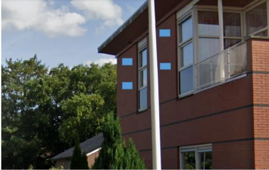
Figuur 9 Manier waarop de huismuskasten aan de noordoostgevel van de brandweerkazerne kunnen worden geplaatst.