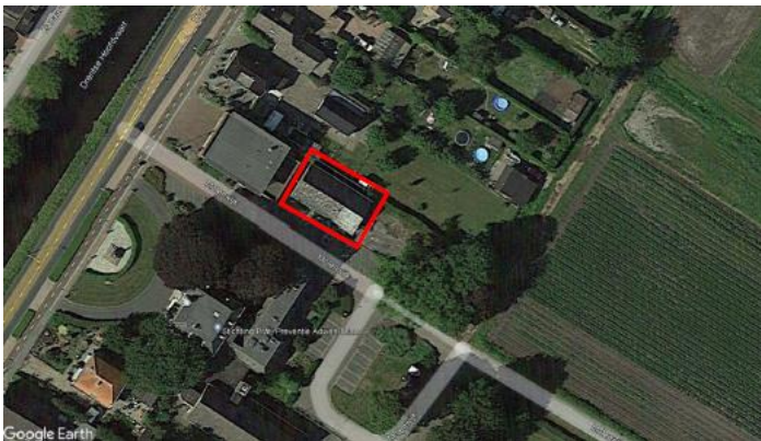
Figuur 1: ligging van het plangebied (rood omlijnd).

Op 1 februari 2022 hebben wij een aanvraag ontvangen voor een ontheffing van de Wet natuurbescherming (Wnb) van de gemeente Midden-Drenthe (hierna ontheffinghouder). Op 2 februari 2022 heeft de ontheffinghouder ons, naar aanleiding van de door ons gestelde vraag, aanvullende informatie toegestuurd. De aanvraag heeft betrekking op een gebouw aan de Hoofdweg 27 in Smilde, gelegen in de gemeente Midden-Drenthe. Het project betreft de sloop van het gebouw gelegen aan de Hoofdweg 27 te Smilde. De ontheffinghouder heeft een ontheffing aangevraagd voor de verbodsbepalingen genoemd in artikel 3.1, lid 2 en lid 4, van de Wnb voor de volgende soort: huismus ( Passer domesticus ).