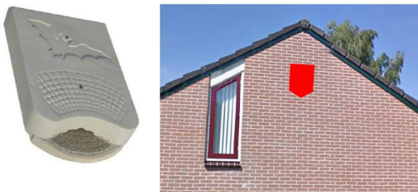
Figuur 3: Schwegler winterkast type 1 WQ en locatie waar kast dient te komen te hangen.

Er dienen minimaal vier geschikte kasten te worden geplaatst binnen een straal van 200 meter van de originele verblijfplaats van de gewone dwergvleermuis. Gezien het feit dat het aangetroffen paarverblijf ook mogelijk in de winter wordt gebruikt, dient er een Schwegler winterkast type 1 WQ gebruikt te worden. De kast is zowel geschikt als paarverblijf als winterverblijf. Om te kunnen voldoen aan de mitigatieplicht, dienen er daarom vier van deze type kasten te worden opgehangen. Indien men kiest voor een ander type kast, dient men hierover in contact te treden met het bevoegd gezag. Woonservice heeft een aantal woningen in eigendom in de buurt van het plangebied waar dergelijke kasten kunnen hangen. Het gaat om de woningen Liniekampen 21-35 en 36-42. De kasten dienen in de nok van de kopgevels geplaatst te worden. Gezien het feit dat deze woningen niet onderzocht zijn op vleermuizen of andere (beschermde) soorten, is het onbekend of er al verblijven of nesten aanwezig zijn. Uit voorzorg dienen de kasten ruim een halve meter van de nok te worden geplaatst.