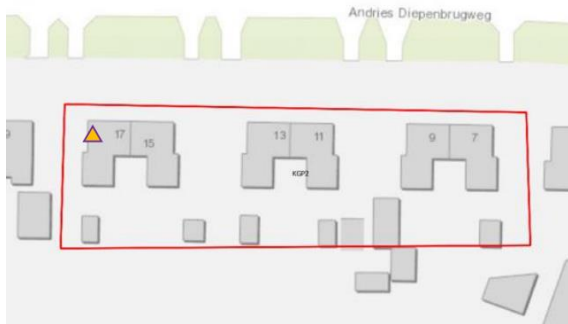
Figuur 2: locatie paar- en winterverblijfplaats gewone dwergvleermuis.