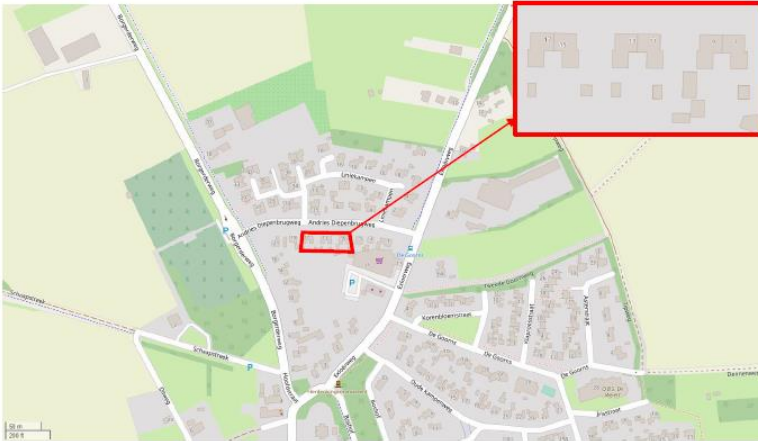
Figuur 1: locatie van het plangebied (rood omlijnd)

Op 20 mei 2021 hebben wij een aanvraag ontvangen voor een ontheffing van de Wet natuurbescherming (Wnb) van ecologisch adviesbureau Buro Bakker/ATKB namens Woonservice (hierna ontheffinghouder). Op 2 februari 2022 heeft de ontheffinghouder ons, naar aanleiding van de door ons gestelde vragen, aanvullende informatie toegestuurd per mail. Het project betreft de sloop en nieuwbouw van woningen aan de Andries Diepenburgweg 7 t/m 17 in Odoorn, gemeente Borger-Odoorn. De ontheffinghouder heeft een ontheffing aangevraagd voor de verbodsbepalingen genoemd in artikel 3.5, lid 2 en lid 4, van de Wnb voor de gewone dwergvleermuis.