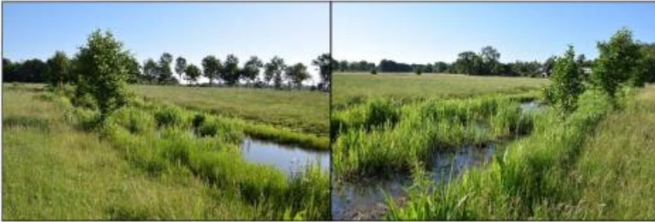
Figuur 3: voorbeeld van flauwe oevers met ruige begroeiing van de huidige watergang die geschikt is voor de poelkikker

De nieuw aan te leggen watergangen en oevers worden geschikt gemaakt als voortplantings- en overwinteringsbiotoop van de poelkikker. De watergangen worden zo aangelegd dat deze in ieder geval in de periode april tot en met september 2022 waterhoudend en niet te diep zijn. De oevers van de watergangen worden zacht glooiend aangelegd met een van helling 1:2 tot 1:5 (zie figuur 3). Minimaal een derde gedeelte van deze oevers bestaat uit ruige oevers met vegetatie. Als aanvulling op de ruige oevers worden enkele steenhopen en/of takkenhopen en stronken langs de toekomstige oevers geplaatst. Op deze wijze kunnen poelkikkers, die de watergang als voortplantingswater gebruiken, overwinteringsplaatsen nabij het water vinden.