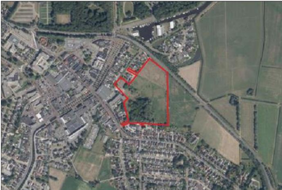
Figuur 1: Kaart met ligging plangebied (rood).

Op 22 april 2022 hebben wij een aanvraag ontvangen voor een ontheffing van de Wnb van BügelHajema namens Heijmans Vastgoed BV (hierna ontheffinghouder). De aanvraag heeft betrekking op het terrein ten noorden van Nietap gelegen in de gemeente Noordenveld. Het project betreft herontwikkeling van het gebied, waarbij 43 energiezuinige wooneenheden worden geplaatst ten westen, noorden en oosten van de voormalige Thedemaborg (figuur 1). Hierbij vinden graaf- en bouwwerkzaamheden plaats waarbij vegetatie verwijderd wordt en grond wordt vergraven. Er wordt tevens een watergang verlengd richting het noorden, waarbij de noordelijke oever deels wordt vergraven. De ontheffinghouder heeft een ontheffing aangevraagd voor de verbodsbepalingen genoemd in artikel 3.5, lid 2 en 4 van de Wnb voor de volgende soorten: poelkikker.