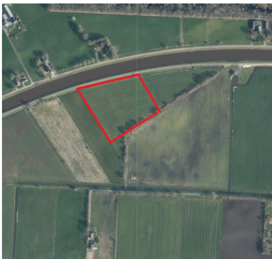
Figuur 1. percelen ontheffing

Wij hebben besloten op basis van onderstaande motivering aan u een ontheffing te verlenen op basis van artikel 3.3 van de Wet natuurbescherming (Wnb) voor het doden van roeken met behulp van geweer ter ondersteuning van de aangebrachte preventieve middelen vanaf één uur voor zonsopkomst ter voorkoming van belangrijke schade aan kwetsbare gewassen op de percelen uit uw aanvraag zoals weergegeven op onderstaande figuur 1.