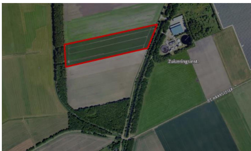
Figuur 1. percelen ontheffing

Wij hebben besloten op basis van onderstaande motivering aan u een ontheffing te verlenen op basis van artikel 3.3 van de Wet natuurbescherming (Wnb) voor het doden van roeken met behulp van geweer ter ondersteuning van de aangebrachte preventieve middelen vanaf één uur voor zonsopkomst ter voorkoming van belangrijke schade aan kwetsbare gewassen op de percelen uit uw aanvraag zoals weergegeven op onderstaande figuur 1.