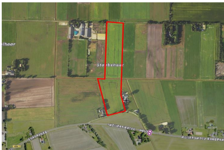
Figuur 1. percelen ontheffing

Wij hebben besloten op basis van onderstaande motivering aan u een ontheffing te verlenen op basis van artikel 3.3 van de Wet natuurbescherming (Wnb) voor het doden van roeken met behulp van geweer ter ondersteuning van de aangebrachte preventieve middelen vanaf één uur voor zonsopkomst ter voorkoming van belangrijke schade aan kwetsbare gewassen op de percelen uit uw aanvraag zoals weergegeven op onderstaande figuur 1.