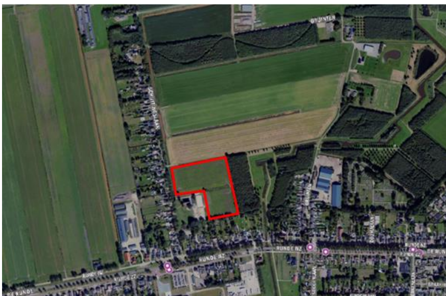
Figuur 1. percelen ontheffing

Wij hebben besloten op basis van onderstaande motivering aan u een ontheffing te verlenen op basis van artikel 3.3 van de Wet natuurbescherming (Wnb) voor het doden van roeken met behulp van geweer ter ondersteuning van de aangebrachte preventieve middelen vanaf één uur voor zonsopkomst ter voorkoming van belangrijke schade aan kwetsbare gewassen op de percelen uit uw aanvraag zoals weergegeven op onderstaande figuur 1.