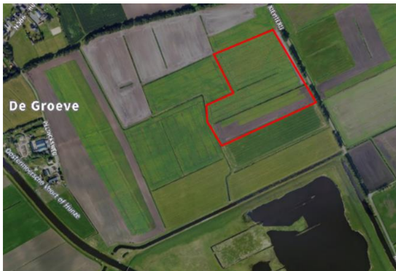
Figuur 1. percelen ontheffing

Wij hebben besloten op basis van onderstaande motivering aan u een ontheffing te verlenen op basis van artikel 3.3 van de Wet natuurbescherming (Wnb) voor het doden van grauwe ganzen met behulp van geweer ter ondersteuning van de aangebrachte preventieve middelen vanaf één uur voor zonsopkomst ter voorkoming van belangrijke schade aan kwetsbare gewassen op de percelen uit uw aanvraag zoals weergegeven op onderstaande figuur 1.