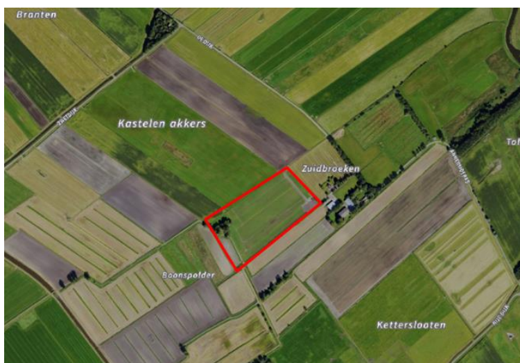
Figuur 1. percelen ontheffing

Wij hebben besloten op basis van onderstaande motivering aan u een ontheffing te verlenen op basis van artikel 3.3 van de Wet natuurbescherming (Wnb) voor het doden van roeken met behulp van geweer ter ondersteuning van de aangebrachte preventieve middelen vanaf één uur voor zonsopkomst ter voorkoming van belangrijke schade aan kwetsbare gewassen op de percelen uit uw aanvraag zoals weergegeven op onderstaande figuur 1.