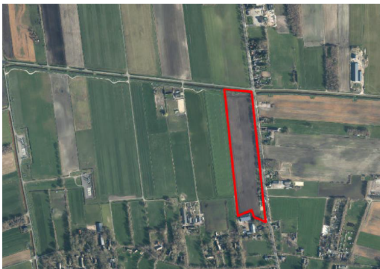
Figuur 1. percelen ontheffing

Wij hebben besloten op basis van onderstaande motivering aan u een ontheffing te verlenen op basis van artikel 3.3 van de Wet natuurbescherming (Wnb) voor het doden van roeken met behulp van geweer ter ondersteuning van de aangebrachte preventieve middelen vanaf één uur voor zonsopkomst ter voorkoming van belangrijke schade aan kwetsbare gewassen op de percelen uit uw aanvraag zoals weergegeven op onderstaande figuur 1.