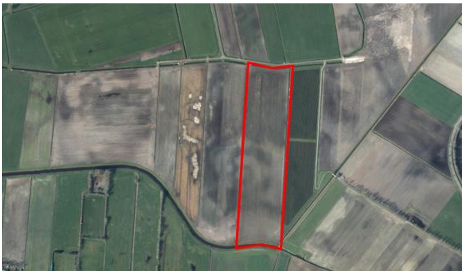
Figuur 1. percelen ontheffing

Wij hebben besloten op basis van onderstaande motivering aan u een ontheffing te verlenen op basis van artikel 3.3 van de Wet natuurbescherming (Wnb) voor het doden van roeken met behulp van geweer ter ondersteuning van de aangebrachte preventieve middelen vanaf één uur voor zonsopkomst ter voorkoming van belangrijke schade aan kwetsbare gewassen op de percelen uit uw aanvraag zoals weergegeven op onderstaande figuur 1.