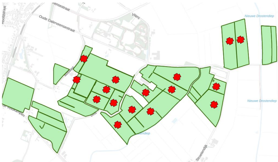
Figuur 1. percelen ontheffing

Wij hebben besloten op basis van onderstaande motivering aan u een ontheffing te verlenen op basis van artikel 3.3 van de Wet natuurbescherming (Wnb) voor het doden van grauwe ganzen met behulp van geweer ter ondersteuning van de aangebrachte preventieve middelen vanaf één uur voor zonsopkomst ter voorkoming van belangrijke schade aan kwetsbare gewassen op de percelen uit uw aanvraag zoals weergegeven op onderstaande figuur 1.