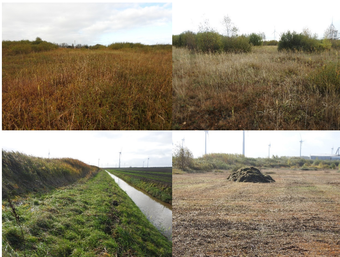
Figuur 2.2 Impressie van het plangebied

De vegetatie is gevarieerd en structuurrijk, er is een afwisseling van delen begroeid met mos, lage grassen, zeggen en russen, kleine vrijstaande struikjes, wilgenstruweel en riet. In dit deel van het plangebied is slechts één boom aanwezig, een forse wilg. Tijdens het veldbezoek was een klein deel van het plangebied recent gemaaid, op basis van de historische luchtfoto's blijkt dat het plangebied in de loop der jaren meermaals is gemaaid. Dit gebeurde vrijwel altijd in delen waarbij er ook overjarige vegetatie bleef staan. Het huidige wilgenstruweel is op zijn hoogst circa 4 tot 5 meter en vermoedelijk niet ouder dan drie jaar. Het rietland in het zuidoosten is vrij dicht en zo'n twee meter hoog, daardoor was dit deel niet inspecteerbaar tijdens het veldbezoek.