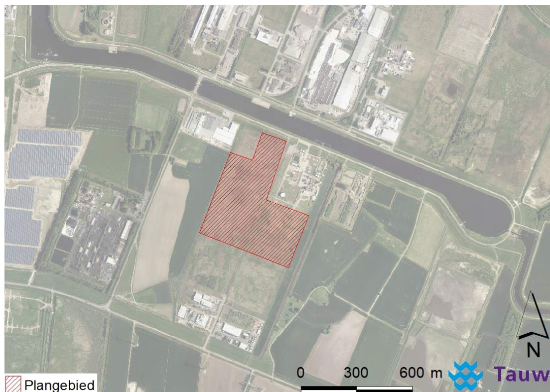
Figuur 2.1 Ligging van het plangebied

Het plangebied is gelegen aan de rand van het industrieterrein Oosterhorn in Delfzijl en ten oosten van Farmsum (zie figuur 2.1). Het plangebied wordt aan de oostzijde omsloten door een smalle strook agrarisch grasland en aan de westzijde door een smalle, vrij ondiepe watergang. Het merendeel van het plangebied is rond 1980 opgehoogd tijdens de aanleg van het Oosterhornkanaal ten noorden van het plangebied. Dit deel ligt zo'n anderhalve meter hoger dan de rest van het plangebied. Een impressie van het plangebied is weergegeven in figuur 2.2.