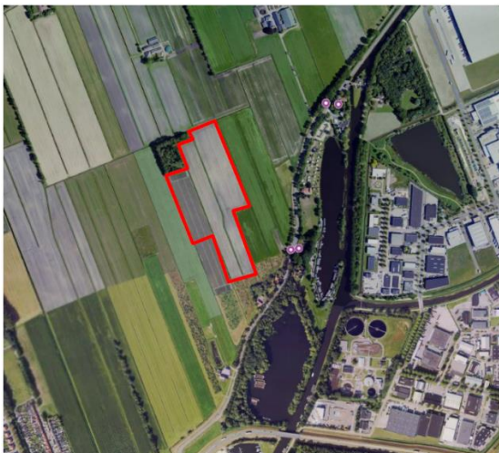
Figuur 1. percelen ontheffing

Wij hebben besloten op basis van onderstaande motivering aan u een ontheffing te verlenen op basis van artikel 3.3 van de Wet natuurbescherming (Wnb) voor het doden van roeken met behulp van geweer ter ondersteuning van de aangebrachte preventieve middelen vanaf één uur voor zonsopkomst ter voorkoming van belangrijke schade aan kwetsbare gewassen op de percelen uit uw aanvraag zoals weergegeven op onderstaande figuur 1.