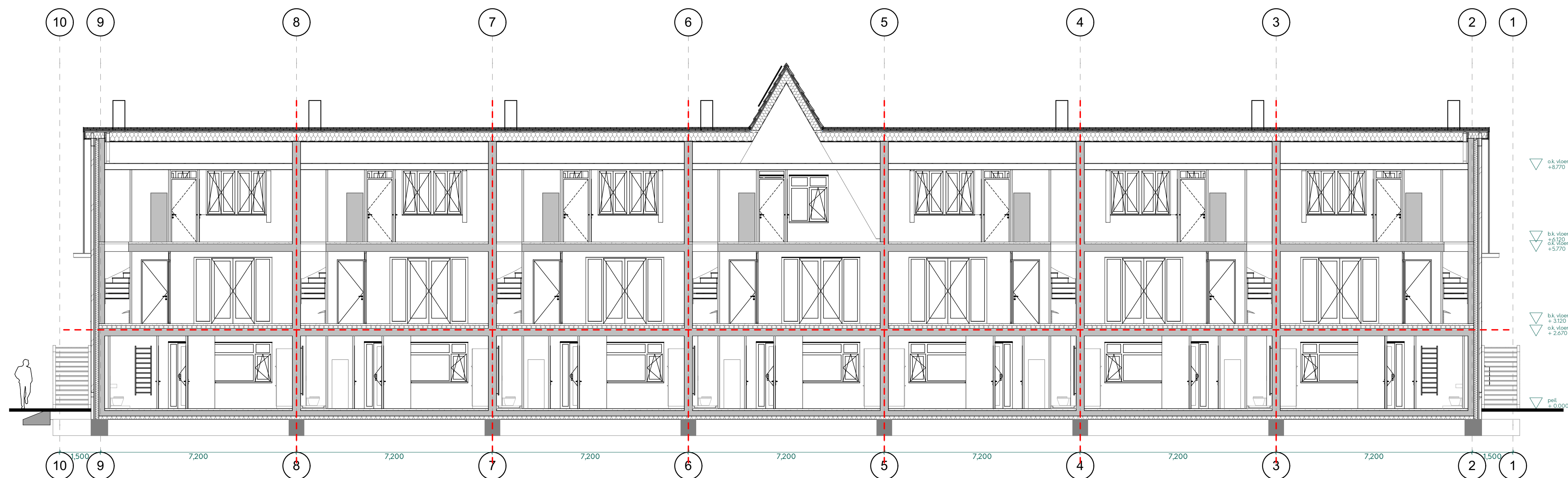
DRS04 - Doorsnede 4

Behoort bij besluit W2020/321 van het college van Kaag en Braassem d.d. 23-08-2021