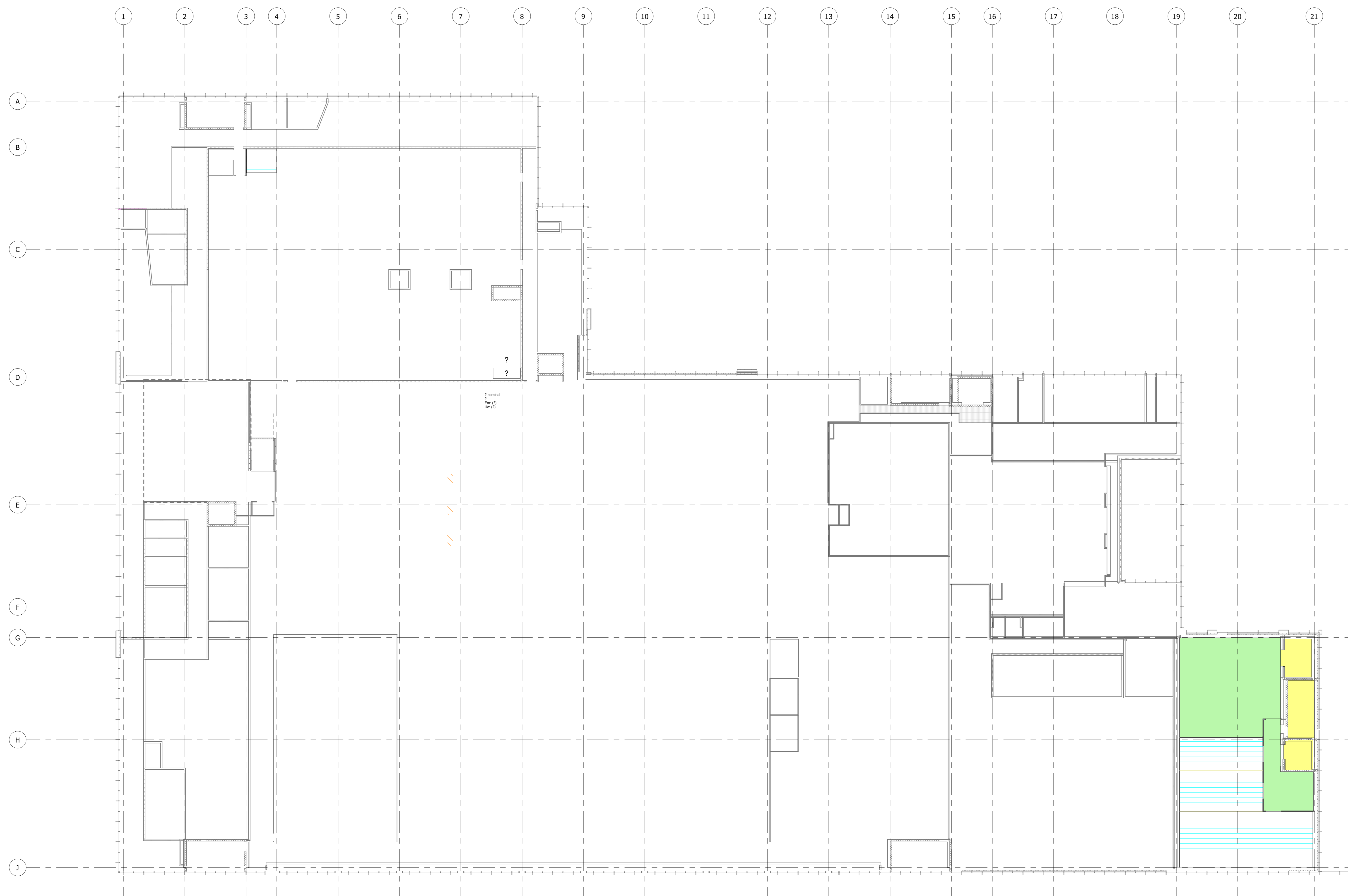
LEVEL 01 - AHU ZONING MEZZANINE SCALE: 1 : 200