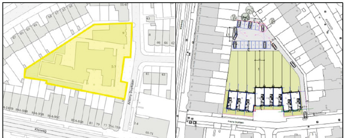
Figuur 1: Ligging van het projectgebied (links) en situering woningen (rechts).

In verband met de aanvraag omgevingsvergunning voor de activiteit 'Handelen in strijd met regels ruimtelijke ordening' voor het project "Antony Duyklaan 5-9" waarbij van het bestemmingsplan "Kleiwegkwartier" wordt afgeweken dienen hogere waarden te worden vastgesteld voor de realisatie van 8 woningen aan de Antony Duyklaan. De locatie is weergegeven in figuur 1.