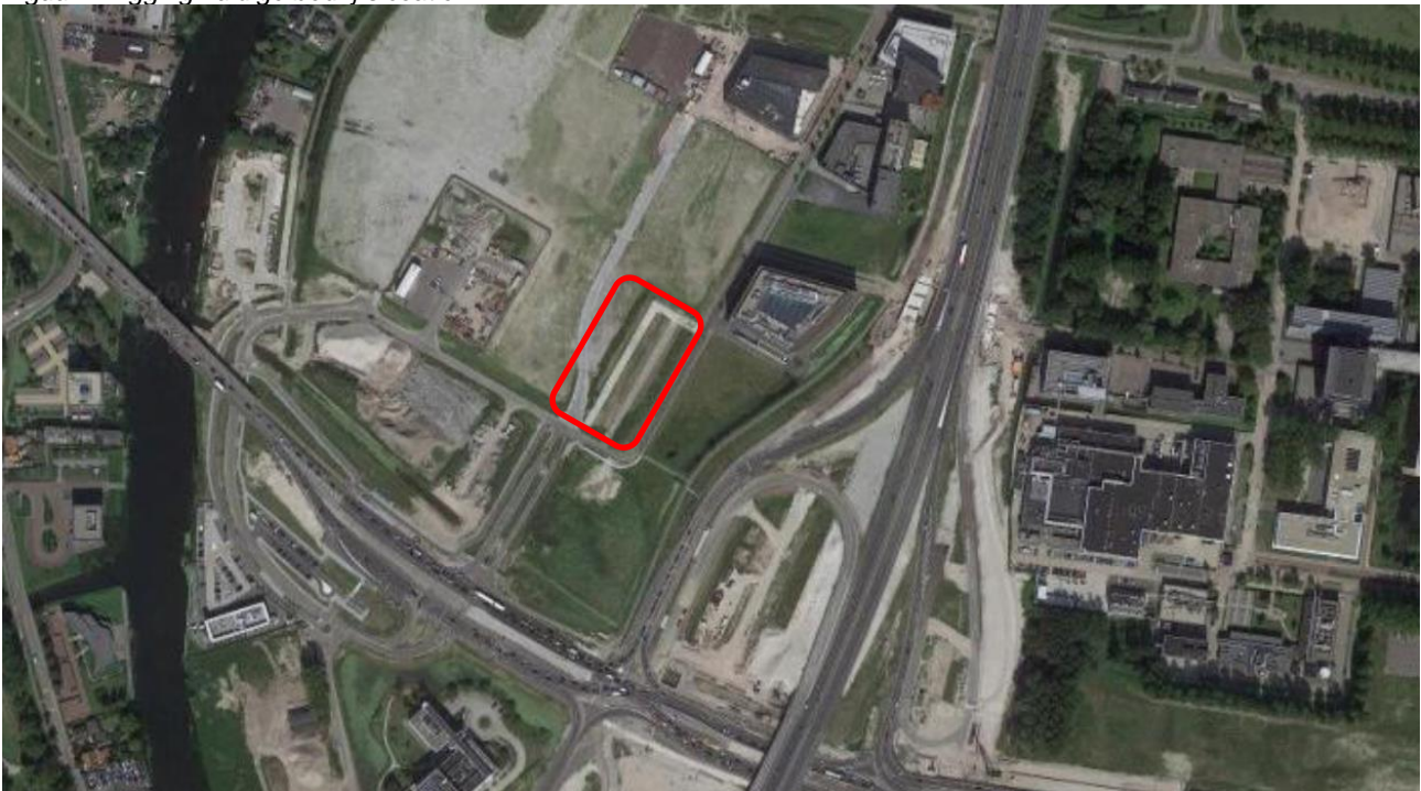
Figuur 1 Ligging huidige bedrijfslocatie

De inrichting is gelegen aan de Francois Aggragotstraat te Oegstgeest en de nabijgelegen A44. Ten zuiden van het terrein bevindt zich de N206. Aangrenzend aan de westzijde van de inrichting bevinden zich woningen tussen de Rhijnhofweg en de Rijn. Aan de noordzijde van de inrichting is het overige deel van Nieuw Rhijngeest Zuid met bedrijvigheid. De afstand ten opzichte van de dichtstbijzijnde woningen ten westen van de inrichting bedraagt circa 200 meter. Dit betreft de woningen gelegen aan de Rhijnhofweg.