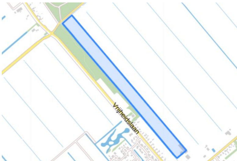
Figuur 1. percelen ontheffing

Wij hebben besloten op basis van onderstaande motivering aan u een ontheffing te verlenen op basis van artikel 3.3 van de Wet natuurbescherming (Wnb) voor het doden van roeken met behulp van geweer ter ondersteuning van de aangebrachte preventieve middelen vanaf één uur voor zonsopkomst ter voorkoming van belangrijke schade aan kwetsbare gewassen op de percelen uit uw aanvraag zoals weergegeven op onderstaande figuur 1.