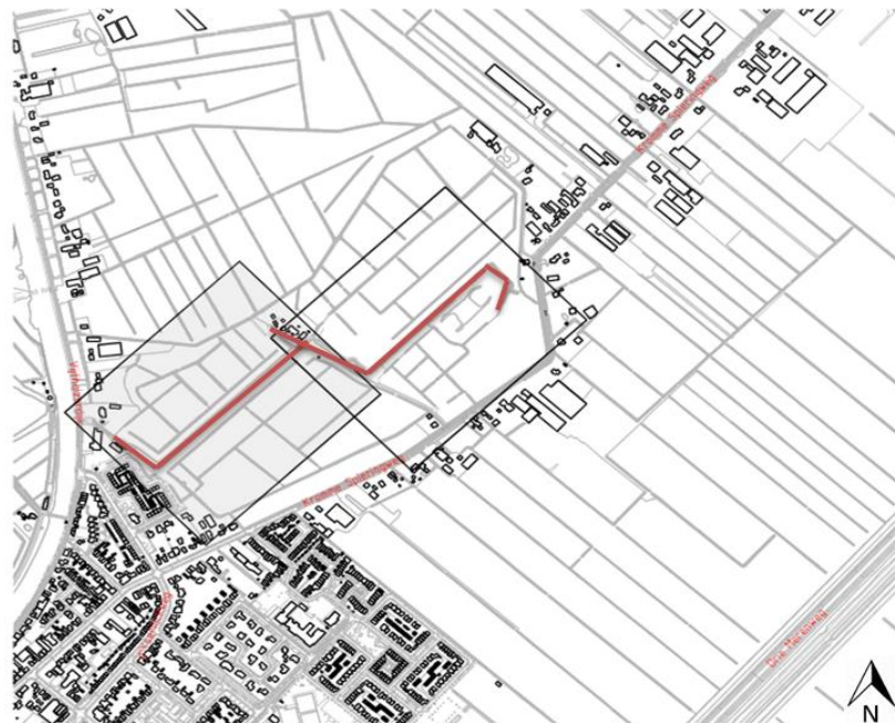
Figuur 1: projectgebied Vijfhuizen (Eendenkooi)

De verbetering van de polderkades te Vijfhuizen (Eendenkooi), een gemeentelijk monument, bevindt zich aangrenzend ten noorden van het dorpskern van Vijfhuizen in het landelijk gebied. De kade loopt van Vijfhuizerdijk 58-61 naar de Kromme Spieringweg 355-357 en vanaf daar door naar de eendenkooi.