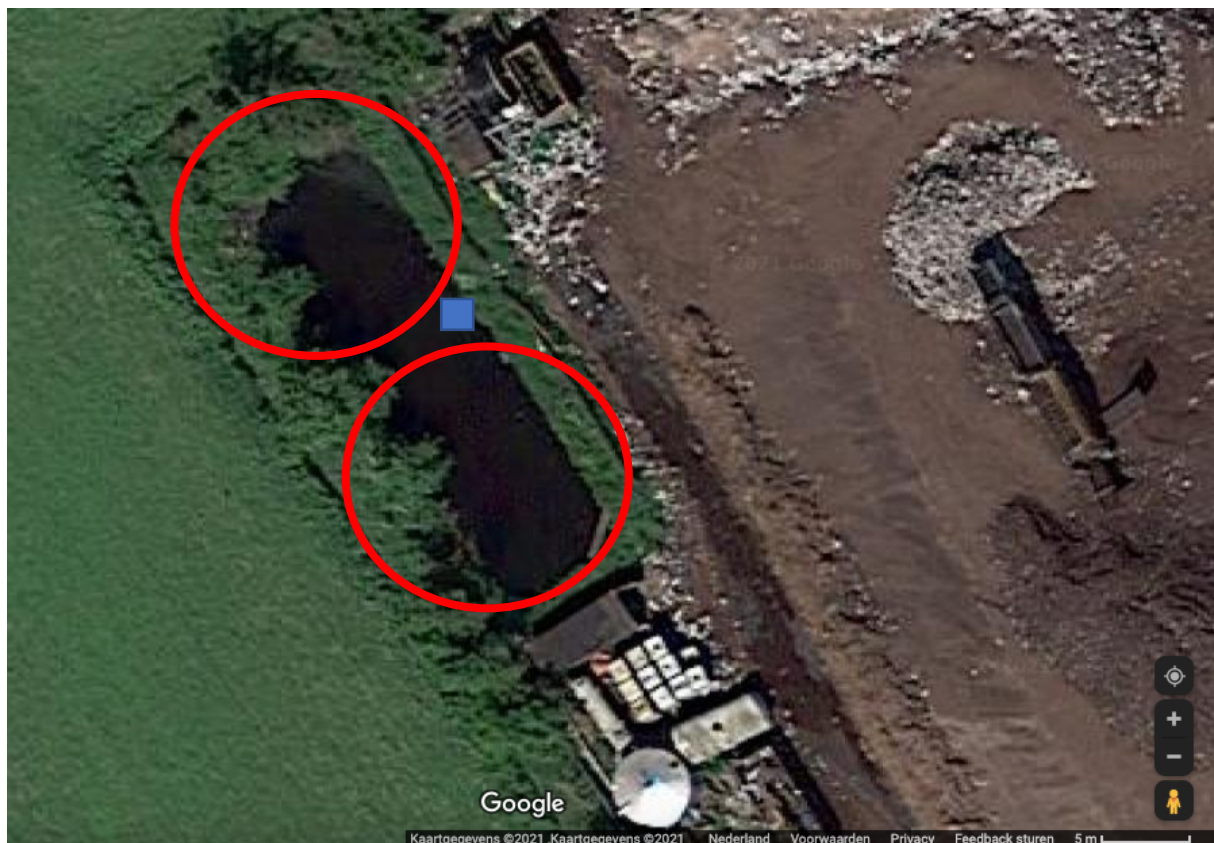
Nieuwe situatie met twee silo's en pompput