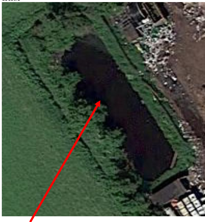
Toekomstige locatie van twee silo's ter plaatse van huidig waterbassin