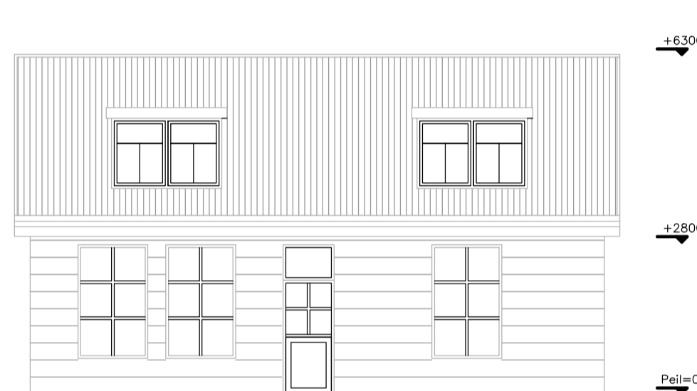
NOORDGEVEL WONING BESTAAND/ONGEWIJZIGD