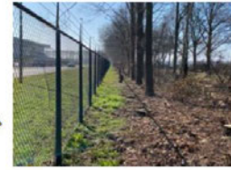
5 Eiken Buiten het hek, op Attero terrein Op ca 3,2 – 3,5 m van het hek Doorsnede ca. 35 cm