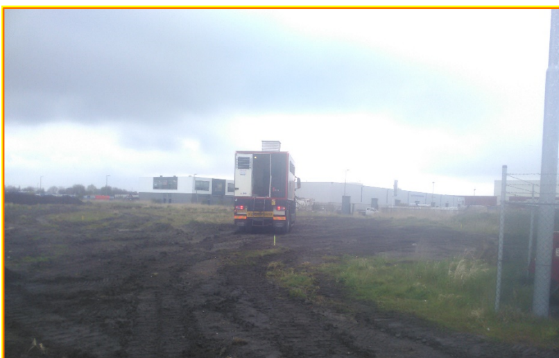
Figuur 1-5: Locatie onderstation