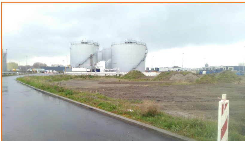
Figuur 1-3: Locatie nieuwe tankput 03