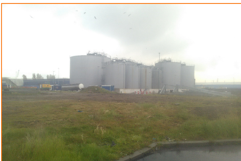
Figuur 1-4: Locatie service gebouw