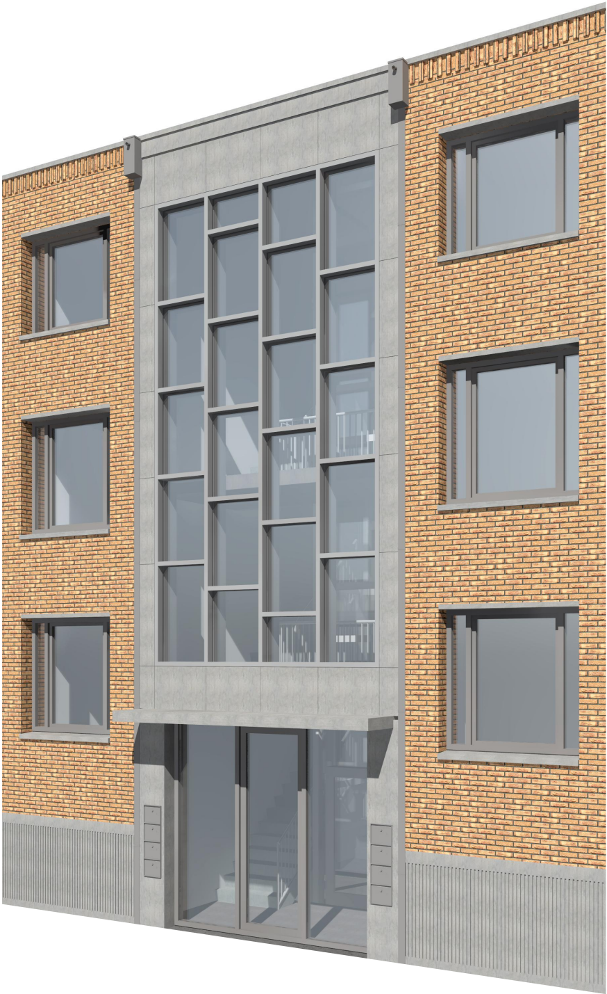
aanpassing n.a.v. welstand