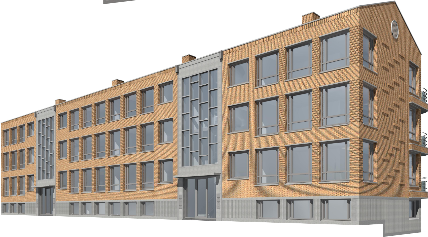
aanpassing n.a.v. welstand