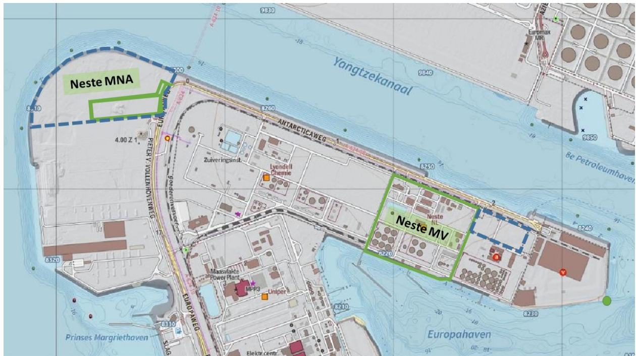
Figuur 1: Ligging van de huidige inrichting van Neste (groen) en de beoogde uitbreiding (blauwe stippellijn)

De huidige inrichting ligt op het haventerrein Maasvlakte aan de Antarcticaweg 185. Daarnaast is er recent een nieuwe AWZI gerealiseerd op Maasvlakte 2. In onderstaande figuur is de ligging van Neste weergegeven in de huidige situatie (groene vlak) en de beoogde locatie voor voorgenomen activiteit (blauwe stippellijn).