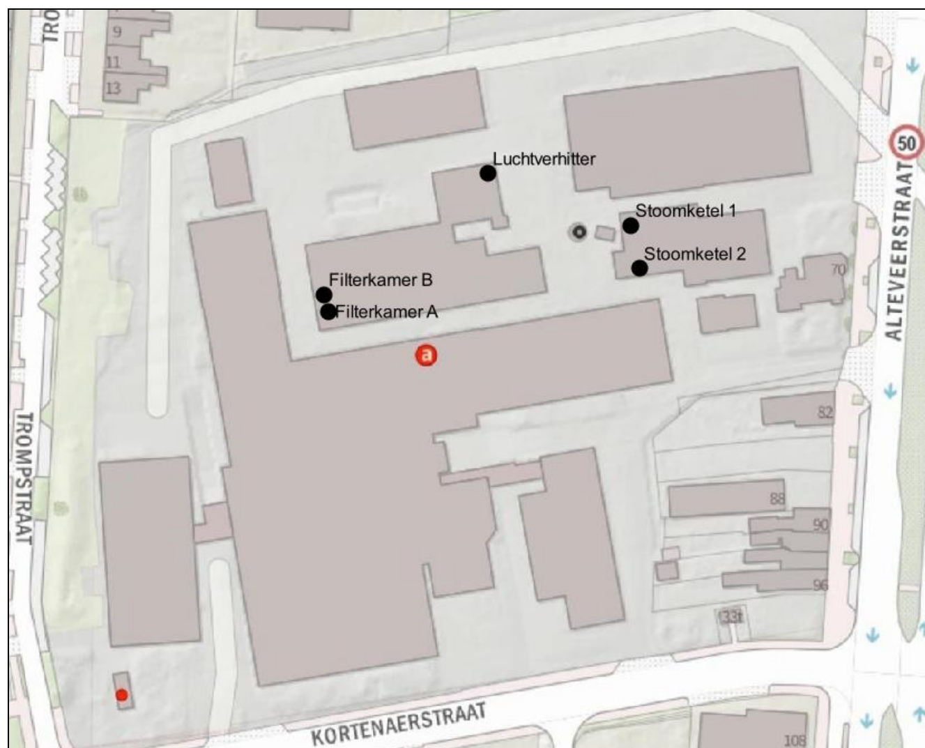
Afbeelding 4.1.1. Situering emissiepunten stationaire bronnen van DOC Kaas in het rekenmodel.

De situering in het rekenmodel van de stationaire bronnen van DOC Kaas is weergegeven in afbeelding 4.1.1. De transportbewegingen op het terrein zijn als een lijnbron ingevoerd (zie afbeelding 3.4.1).