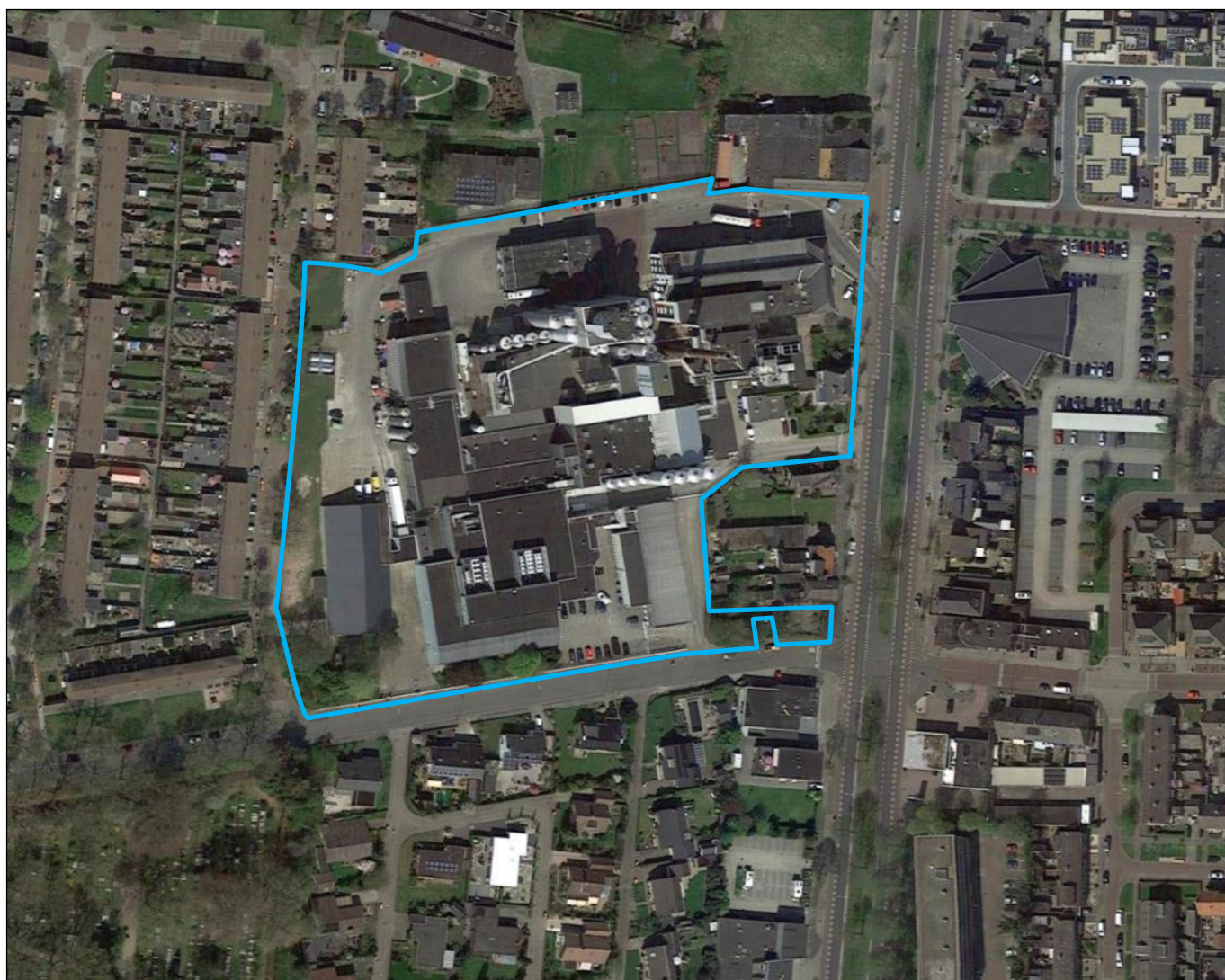
Afbeelding 3.1.1. Bovenaanzicht van de bedrijfslocatie (blauw kader = terrein van het DOC Kaas).

De hoofdactiviteit van DOC Kaas is het verwerken van melk tot kaas, magere melkcondens, melkpoeder en room. De inrichting is aan vier zijden omgeven door woonbebouwing. Naast woningen zijn in de directe omgeving van DOC Kaas een sportaccommodatie, kinderopvang, enkele winkels en horeca en een kerkgebouw gevestigd. Ten zuidwesten van het bedrijfsterrein bevindt zich een begraafplaats. Afbeelding 3.1.1 geeft de ligging weer van het terrein van DOC Kaas in de omgeving.