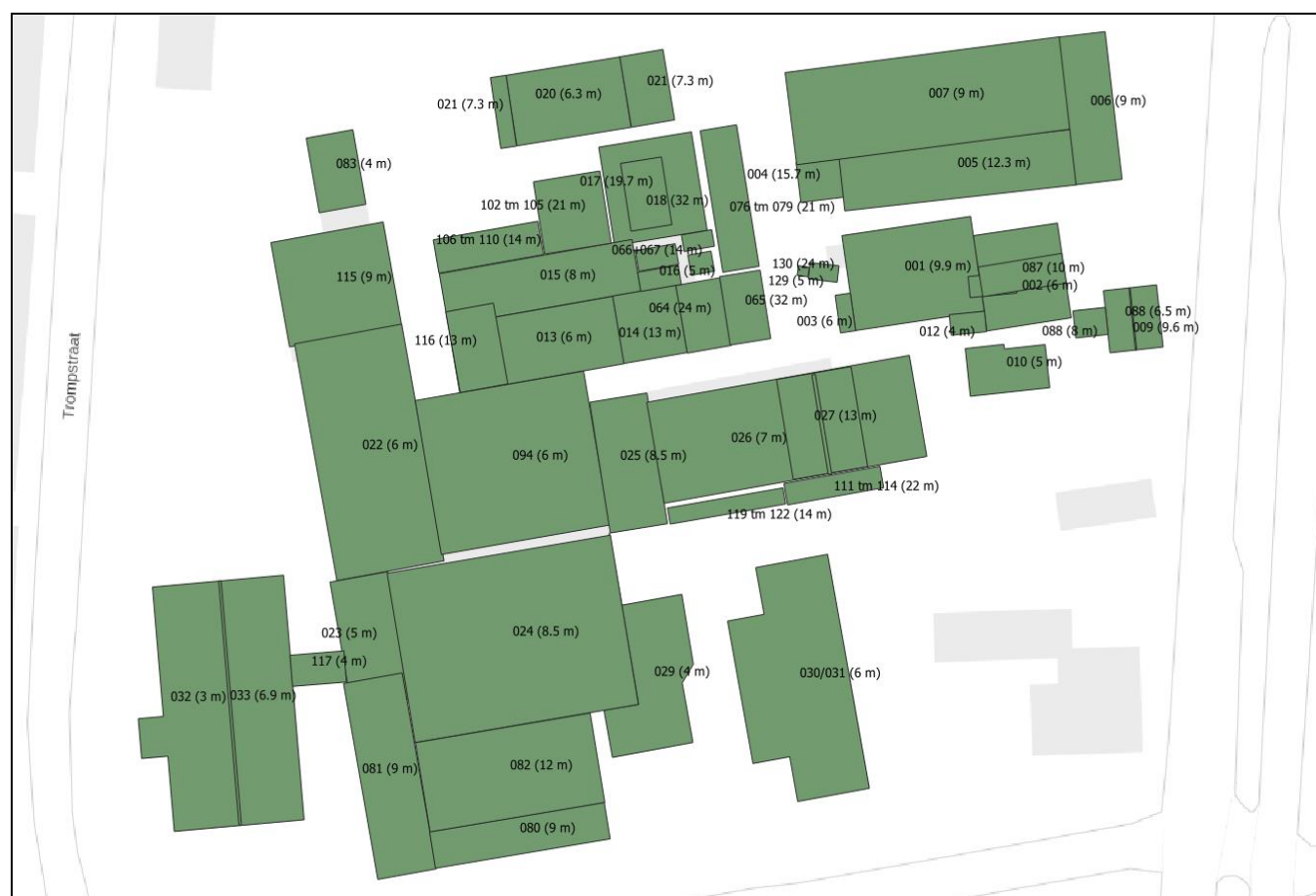
Afbeelding 4.4.2. Gebouwen op het terrein van DOC Kaas in het rekenprogramma Geomilieu.

De schoorsteenhoogte van de stationaire emissiepunten van DOC Kaas varieert tussen 15 en 21 meter (zie tabel 3.2.1 en tabel 3.3.1). De hoogte van de bedrijfsgebouwen varieert sterk. Relatief hoge bouwwerken op het terrein van DOC Kaas zijn de poedertoren, de indamper en de daaromheen gelegen opslagtanks. Samen vormen deze relatief hoge bouwwerken het dominante gebouw voor alle stationaire emissiepunten op het terrein van DOC Kaas: stoomketel 1, stoomketel 2, luchtverhitter en filterkamer A en B. Hiertoe is één blokvormig vervangingsgebouw A als volgt opgenomen in het rekenmodel (zie ook afbeelding 4.4.3 en bijlage 1):