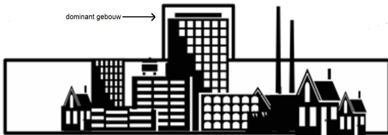
Afbeelding 4.4.1. De aanwezigheid van één dominant gebouw bij het emissiepunt.