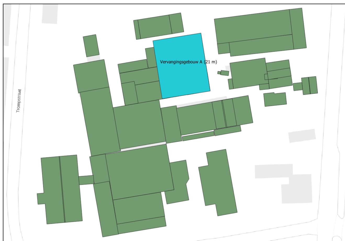
Afbeelding 4.4.3. Situering van de dominante gebouwen die zijn meegenomen in het rekenmodel (blauw).

Om vervangingsgebouw A als dominant gebouw te kunnen koppelen aan de stationaire emissiepunten, zijn de overige, dicht bij de emissiepunten gelegen gebouwen uit het rekenmodel verwijderd (zie bijlage 1). Ter illustratie zijn de volledige invoergegevens van alle beschouwde gebouwen op het terrein van DOC Kaas weergegeven in bijlage 2, overeenkomstig afbeelding 4.4.2.