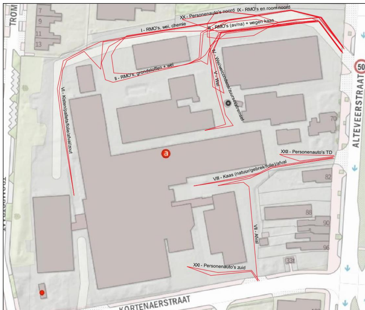
Afbeelding 3.4.1. Rijroutes verkeersbewegingen op het terrein van DOC Kaas in de aangevraagde situatie.

De rijroutes op het terrein van DOC Kaas zijn weergegeven in afbeelding 3.4.1. Ook deze rijroutes zijn consistent met het “Akoestisch onderzoek t.b.v. kaasfabriek D.O.C. te Hoogeveen aanvraag 2020”, 16 juli 2020, van Adviesburo Van der Boom en met de recentelijk ingediende aanvraag voor een vergunning krachtens de Wet natuurbescherming. Alle rijroutes op het terrein van DOC Kaas zijn in het model ingevoerd als rondrijdroute, zodat het aantal verkeersbewegingen overeenkomt met het aantal voertuigen. Er zijn geen rijroutes in het model opgenomen waarover heen en terug wordt gereden.